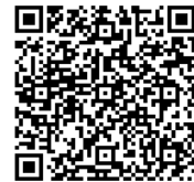
特別定額給付金事業推進班 ホームページ(QRコード)

<参考> 令和2年4月20日現在、対象者は203,353人、対象世帯は91,705世帯