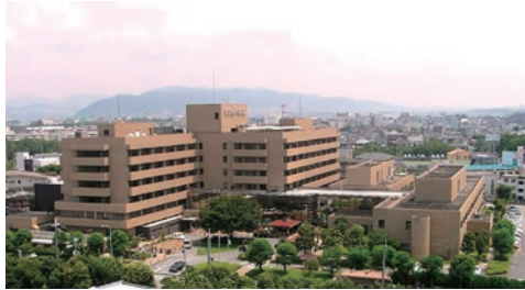
市立伊丹病院ホームページより

*1 地域医療構想調整会議: 県の定める医療圏ごとの計画にもとづく病床利用を調整する会議