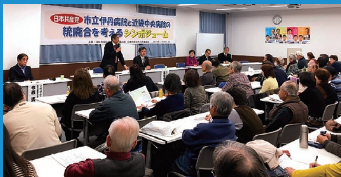
2月9日、党議員団・市委員会主催で「市立伊丹病院と近畿中央病院の統廃合を考えるシンポジウム」を開催。不安の声が続出しました。